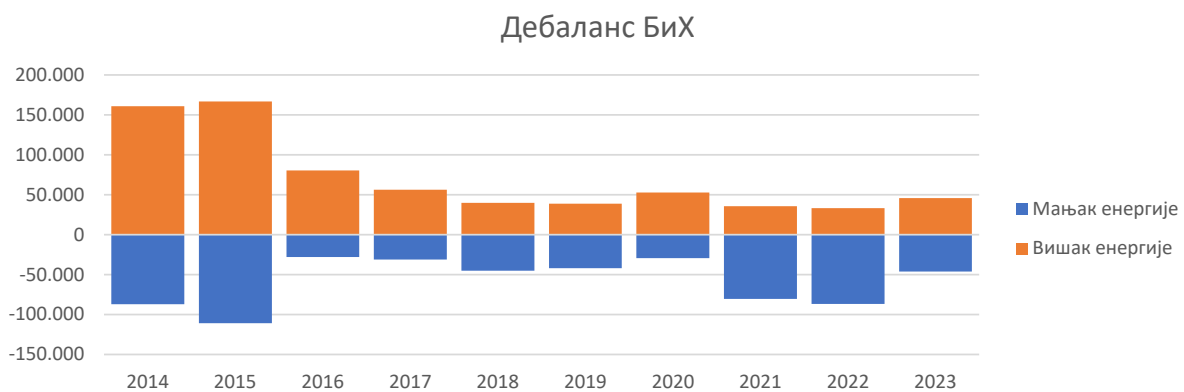
Слика 2: Годишња одступања регулационог подручја БиХ

У табели 8. приказане су вриједности ангажоване балансне енергије, цијене енергије и одговарајући трошкови, узимајући у обзир прекограничне ангажмане због потреба ЛФЦ подручја БиХ и изузимајући електричну енергију ангажовану унутар БиХ за потребе других оператора система.