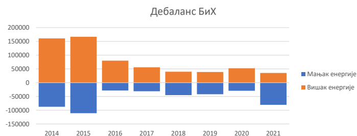
Слика 2: Годишња одступања регулационог подручја БиХ

У табели 7. приказане су вриједности ангажоване балансне енергије, цијене енергије и одговарајући трошкови, узимајући у обзир прекограничне ангажмане због потреба регулационог подручја БиХ и изузимајући електричну енергију ангажовану унутар БиХ за потребе других оператора система.