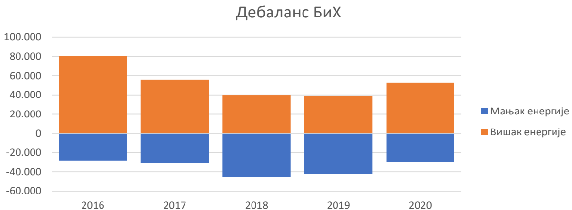
Слика 2: Годишња одступања регулационог подручја БиХ

Из података за ангажовану балансну енергију и остварене дебалансе може се закључити да су се током 2020. године у систему БиХ чешће појављивали вишкови електричне енергије. На слици 2 приказана су одступања регулационог подручја БиХ у посљедњих пет година.