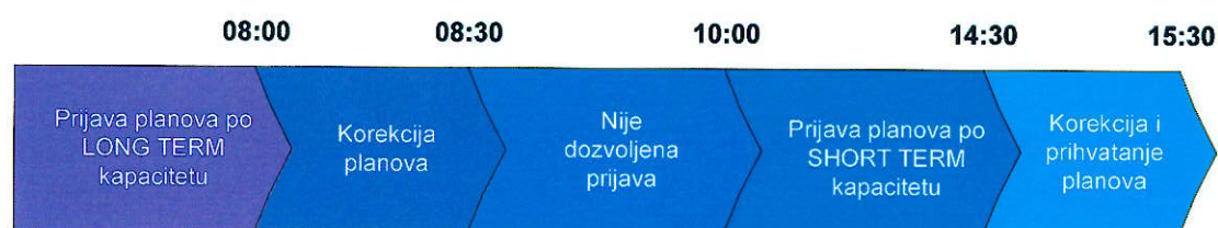
Slika 4.1.1: Vremena nominacije i korekcije Dnevnih rasporeda u danu D-1